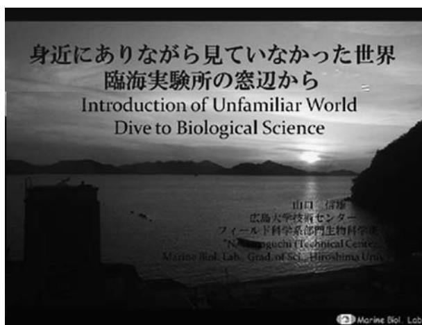
図1 講義タイトル(臨海初日の出)

まず臨海実験所に集合したのち、所員紹介及び施設使用上の注意を行い、生物学に関する講義「身近にありながら見ていなかった世界 臨海実験所の窓辺から」(図1)を行った。この中で生物学とは何か、特に海洋からの生物の進化と生物多様性に関してレクチャーを行い、さらに海洋生物の生態や採集方法などについて紹介した。悪例や事故についても紹介した。