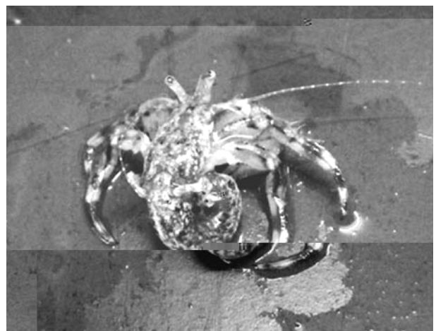
図7 ホンヤドカリ (節足動物門:熱処理で生きたまま殻から出した状態)

その後、クマノコガイという巻貝を用いて、貝殻に含まれる真珠層を露出させる実験(酸による脱灰処理)を行った。この貝殻も後で細かい処理をしたのち、学祭企画「ビオトープで遊ぼう」及び理学研究科による公開授業に提供した。最後に臨海実験所玄関にて、記念撮影をして解散した。