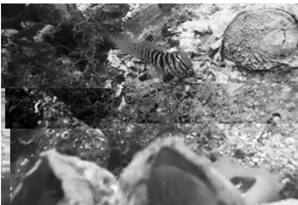
図5 ナベカ(脊索動物門スズキ目イソギンポ科)

これらの普段では気が付かない多様な生物を、図鑑を用いて各自で同定・分類し、さらにそれぞれの生物に関する知識を講師が補完した。採集できた生物は初日に講義で示した多数の動物門の一端ではあったが、その多様性は参加者の想像を遥かに超えていたと思われる。採集した生物は、学祭企画及び臨海実験所で展示するものを除いて放流した。