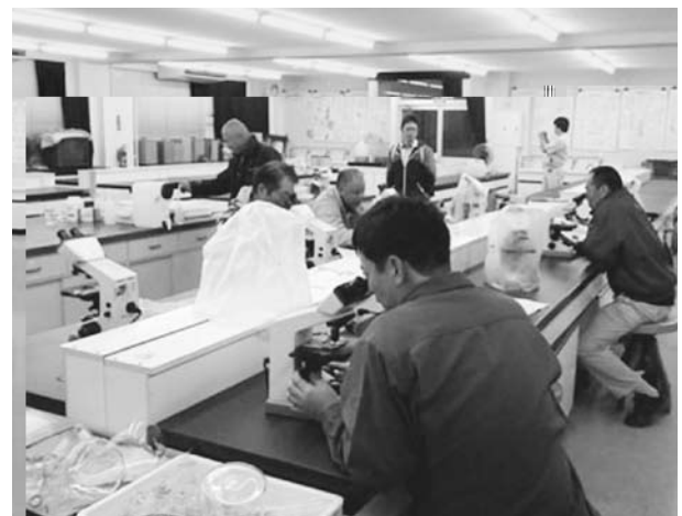
図3 ウミホタルの光学顕微鏡による観察

翌日は早朝より磯歩きによる生物採集を行った。この時間帯になった理由は、その日の干潮が早朝もしくは夜間のため、早朝を選択せざるを得なかったためである。このことから、生物や自然を相手にする業務では、既定の業務時間どおりに作業することの困難な現状とそれに対する対応策の難しさが浮かび上がった。今回は臨海実験所近海(図4)の亜干潮帯(砂場・岩場・