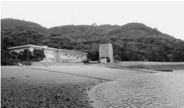
図4 採集地付近からの臨海実験所周辺の風景

泥場・タイドプール等)で約2時間超の採集を行い、約50種を実験所に持ち帰った(図5, 6, 7)。