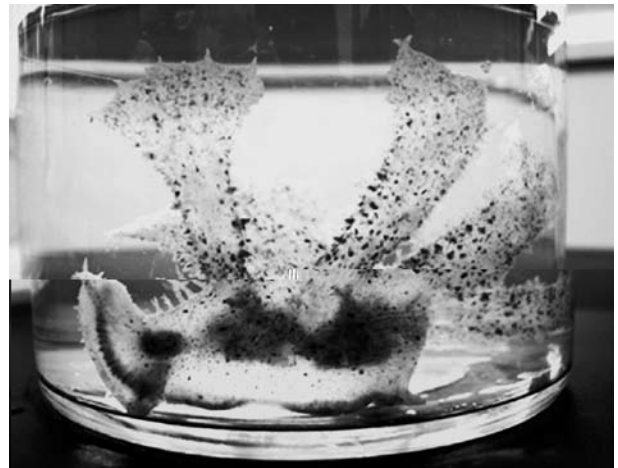
図6 メリベウミウシ(軟体動物門)