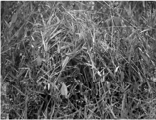
15. ふれあいビオトープのカヤネズミの巣