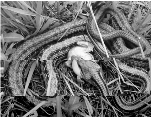
11. シマヘビがシュレーゲルアオガエルを捕食中 シュレーゲルアオガエルは肺を膨らませて 飲み込まれないように抵抗中