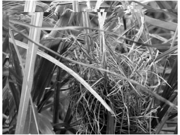
14. カヤネズミの巣 となりの三ヵ月後