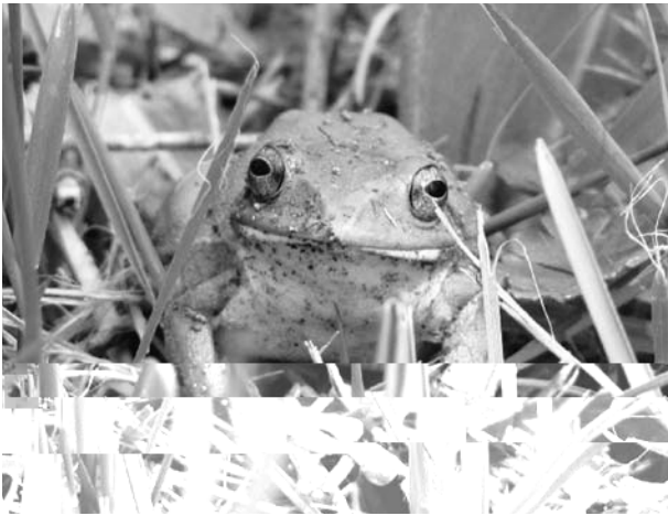
3. シュレーゲルアオガエル