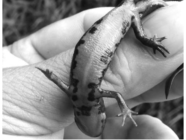
8. アカハライモリの腹側