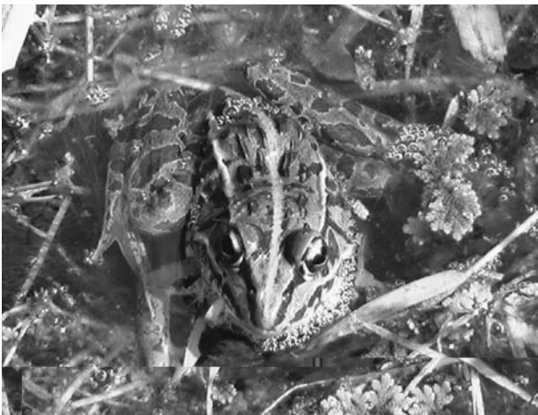
5. トノサマガエル オス