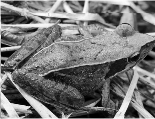
1. ニホンアカガエル