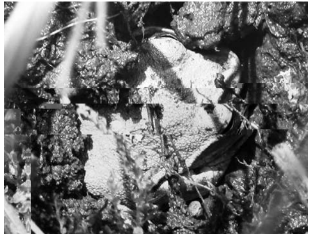
4. 土の中で鳴いているオスを掘り出した所