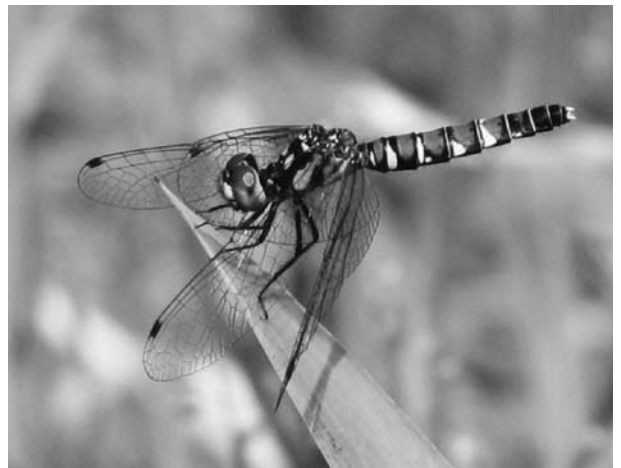
18. ハッチョウトンボ メス