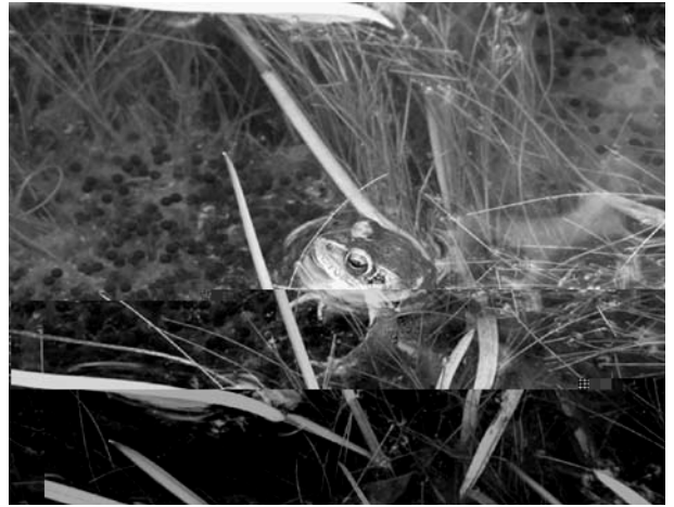
2. 卵塊の前でメスが来るのを待ち受けているオス