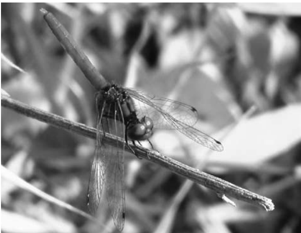
17. ハッチョウトンボ オス