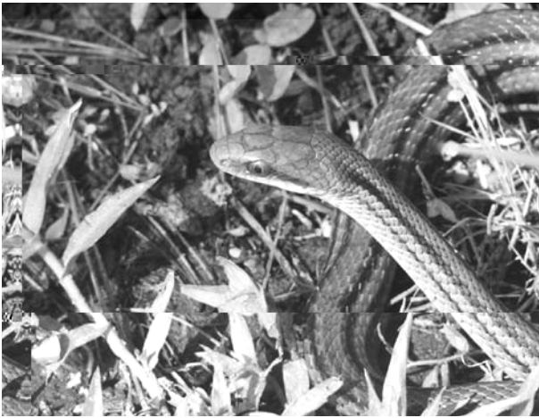
9. シマヘビ(しましま)