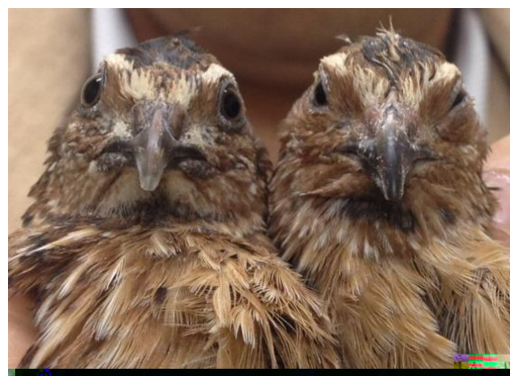
雌にモテない雄（左）とモテる雄（右）

性的対立とは、雌雄間に生じる繁殖をめぐる競争の衝突を指す。その発生は、雌雄間で異なる繁殖戦略を有する個体間の競争に起因し、雄は低コストの精子を大量生産するという事実があり、これにより、繁殖戦略上の違いが生まれ、様々な対立が生じると考えられている。これまで性的対立は主に進化生物学や動物行動学の分野で研究されてきた。しかし最近の動向では、対立の構図が動物の行動、集団、個体のレベルから、雌雄の組織、細胞、分子および遺伝子レベルでも観察されること