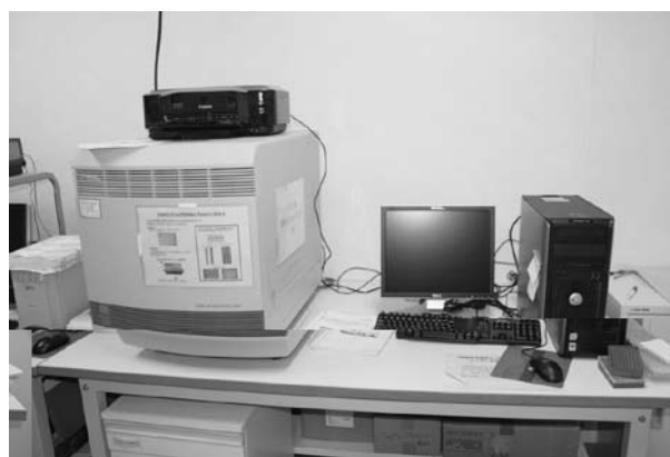
図1. リアルタイムPCR装置 (Applied Biosystems 7900HT). PCR増幅産物の増加をリアルタイムでモニタリングし，定量的に解析を行う

先述の通り，生命科学機器分析部における教育・研究支援業務は大きく二つに分類される。一つは研究機器の提供である。生命科学機器分析部に設置されている機器はオートクレーブ，分光光度計，遠心機などの一般的なものから，リアルタイムPCR装置，質量分析装置，電子顕微鏡，フローサイトメーター，共焦点レーザー顕微鏡のように利用目的が特化したものまで，約40種におよぶ（詳細は，生命科学機器分析部のwebサイトに掲載されている機器のリストをご参照いただきたい）。必要に応じて，利用者に機器の操作方法の説明を行っている。さらに，要望があった際には実験手法・解析のコンサルティングも行っており，利用者の研究がスムーズに進むよう，日々努めている。