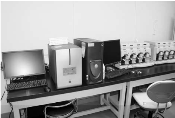
図7 . DNA マイクロアレイ解析システム( Affymetrix GeneChip Scanner3000TG ). 遺伝子の発現や多型の解析を網羅的に行う .