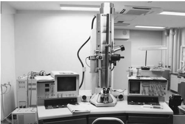
図3．透過型電子顕微鏡（HITACHI H-7100）．観察対象に電子線を当て、それを透過してきた電子が作り出す干渉像を拡大して観察する．