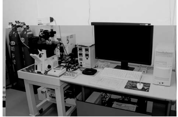
図5．インキュベーター付共焦点レーザー顕微鏡（OLYMPUS FV1000-D）．蛍光標識標本から優れた2次元、3次元画像を取得する．インキュベーターを使うことにより、生細胞の反応を観察できる．

サービスである．現在、塩基配列決定サービス、GeneChip 実験支援、セルソーティング実験支援の三つのサービスを提供している．