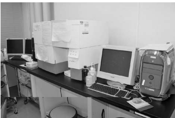
図4．フローサイトメーター（Becton Dickinson FACSCalibur）．蛍光色素による標識を基に、細胞集団の情報を解析する．