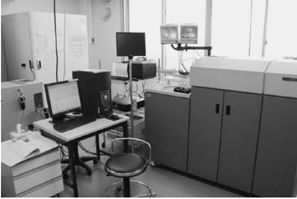
図2．質量分析装置（Applied Biosystems QSTAR）．イオン化された試料の質量電荷比を計測する．