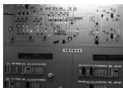
実験排水処理設備