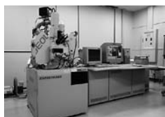
電子プローブ マイクロアナライザ