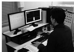
放射性同位元素の 同定作業