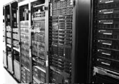
各種サーバ群 (WWW, メール等)