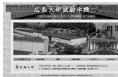
コンテンツ作成・管理 (例: 広島大学試験水槽のWeb サイト)