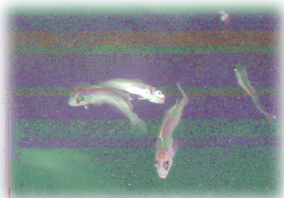
アカアマダイVNN罹病魚

本研究は、栽培漁業や養殖業で注目されるアカアマダイやクロマグロなどの新規対象種に頻発するVNNについて、その感染源が養成親魚および野生魚であることを明らかにするとともに、増養殖現場に応用可能な防除対策法を検討したものである。