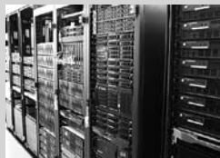
各種サーバ群 (WWW, メール等)