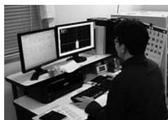
放射性同位元素の 同定作業