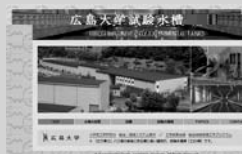
コンテンツ作成・管理 (例: 広島大学試験水槽のWebサイト)