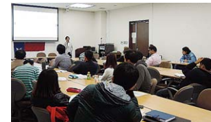
東広島キャンパスのセミナー風景

学生が幅広い知識を習得するための「分野融合セミナー」の一環として、広島大学大学院国際協力研究科と協定校のテキサス大学オースティン校 The LBJ School of Public Affairs より支援を受け、7月6日～8月5日までの夏期研修(2015 Public Management and Leadership Programおよび2015 Politics and Policy Program)に、たおやかプログラムの教職員とともに当プログラム所属学生が1名参加し、広島大学より合計4名が参加しました。