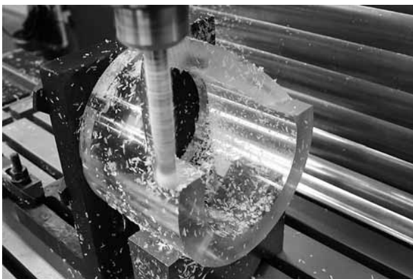
実際の亚克力加工