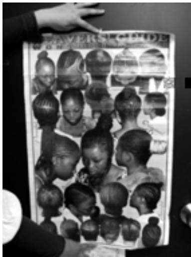
ガーナ美容院のヘアスタイルポスター