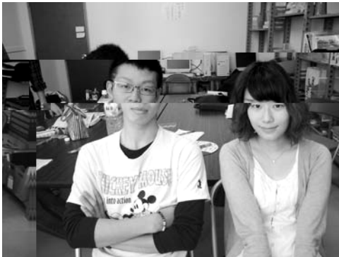
2人で総科を引っ張っていきます！

すごくヘラヘラしていますが、実際 はとてもデリケートな人です。でも、 そのゆるさが良いのだと思います。総 代がガチガチしていたら、全体的に硬 い雰囲気になってしまうので。トップ