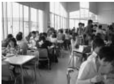
席はどつちもいっぱい!

現在の定番メニューは昔から続いているようです。しかし、この中でジャーマンハンバーグだけはメニューからなくなつてしまつています。どんな料理だったのか気になりますね。