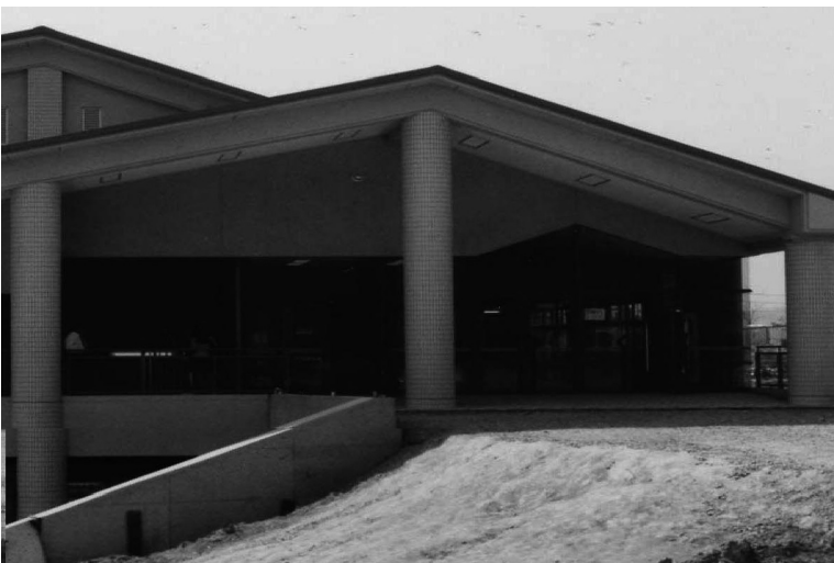
整備途中の西2食堂前