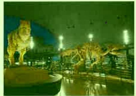
福井県立恐竜博物館