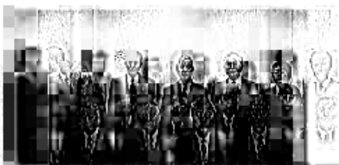
就現居地國籍の国別会（防西文化サロンにて） 四川館・シタール科（前8頁から32人目）、前巻「前巻」

ない。「企業」の求めた材料は、一応への期待」を期していた。一枚に封する熱き起い、を閉つていたんだ。 現在（今日）は動二五〇名であるが、今段さらに増えるものと思われ、平塚十二年度決算は、北條氏の精励の結果、名以上、東海道の増強のため、金貨が五匁・同銀則などの支部を計数面設置していくことになった。こうした働きが全く 福岡県と九州地区が不景気に陥る中、衆議院勸業学校長が東京回覧会活動の一環になれば、就職率の改善に大きく貢献することになるものと期待している。