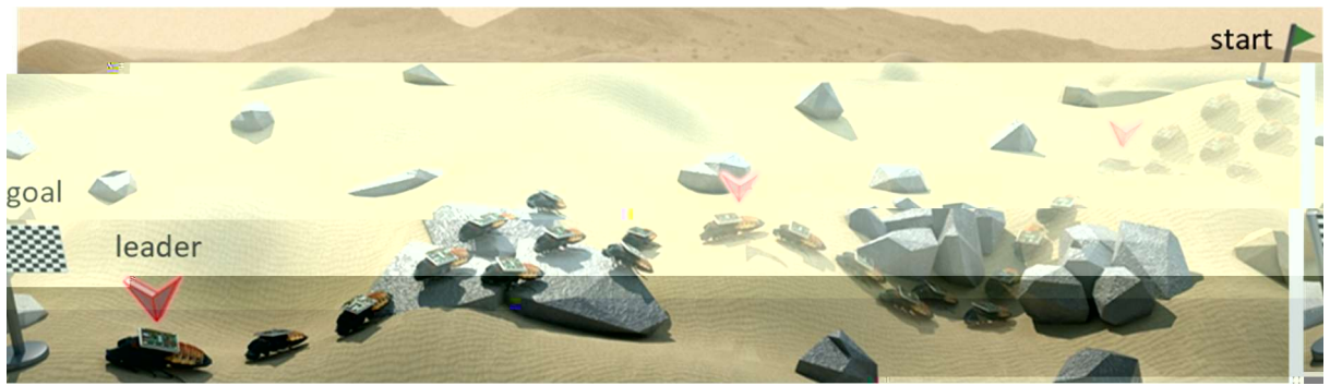
図1:複数のサイボーグ昆虫が、一匹のリーダーサイボーグに従って群れ移動するイメージ図