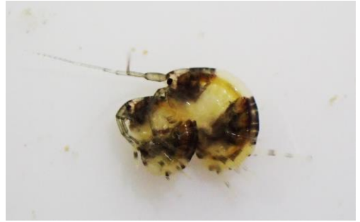
パンダメリタヨコエビの交尾前ガードの様子で、向かって左が頭部（左が雌，右が雄）。