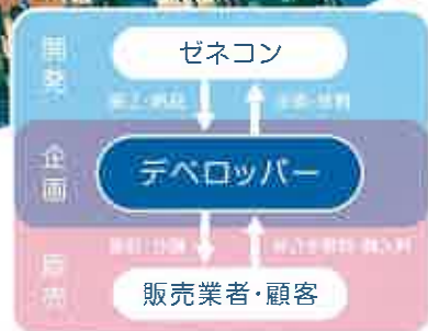
■不動産デベロッパーのビジネスモデル