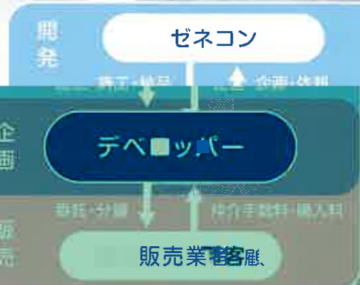
■不動産デベロッパーのビジネスモデル