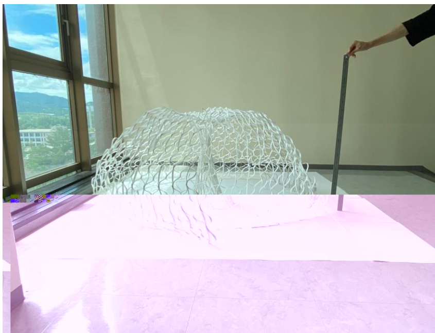
写真3 1/2 スケールの検討模型