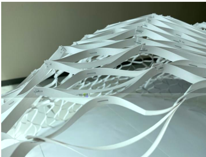
写真1 接合などの検討