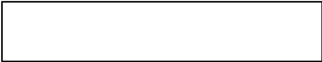
表 1 保健教育本来の魅力に迫るための養護教諭の資質・能力