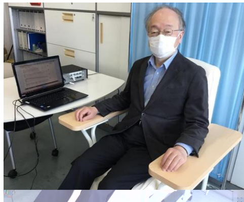
計測風景（胸部の背面、腰部などから脈波採取中）