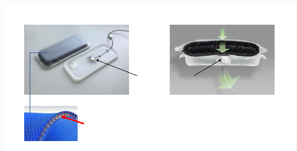
生体信号計測用センサ： システム