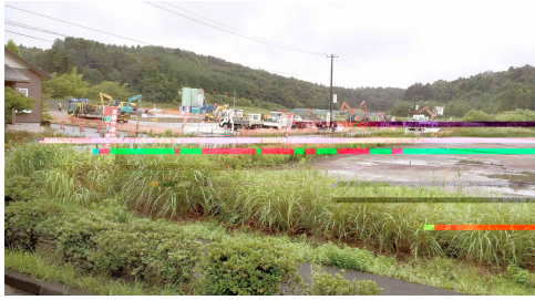
視察に訪れた福島県(帰宅困難地域)