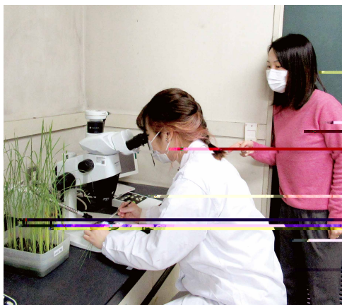
研究室の学生と、顕微鏡を使ってイネの微細構造を観察する様子