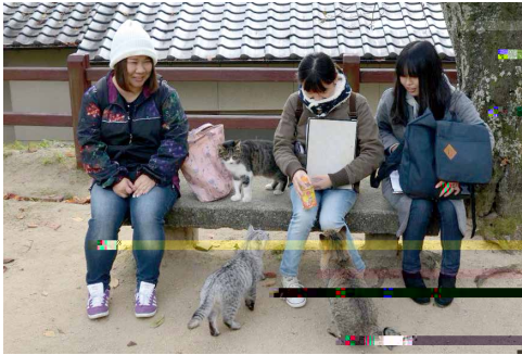
尾道市で野良猫の個体識別調査を実施した(2枚とも)