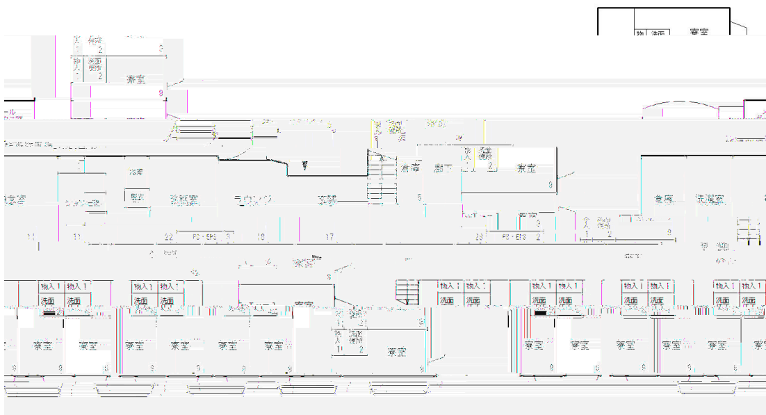
女子学生宿舎 各階平面図