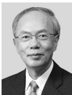
広島大学 理事・副学長(財務担当)