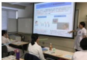
充実した講義科目、少人数での講義