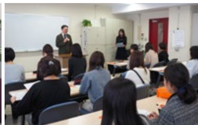
オリエンテーション風景