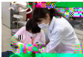
超音波スケーラーやPMTCなど臨床手技の習得