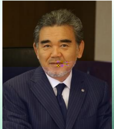
越智 光夫 広島大学長