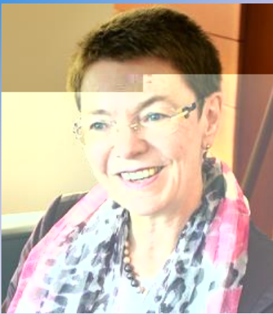
パトリシア・フロア 駐日欧州連合特命全権大使