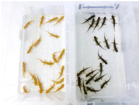
色素合成遺伝子ノックアウトイモリ (当世代) イベリアアトゲイモリ野生型