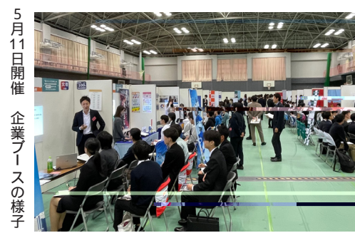
5月11日開催 企業ブースの様子

【開催実績】 5月11日(土) 来場者数：402名 出展企業数：34社 10月26日(土) 来場者数：129名 出展企業数：20社