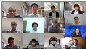
未来を拓く地方協奏プラットフォーム(HIRAKU)について、詳細はこちら https://hiraku.hiroshima-u.ac.jp/

2021年7月30日に、未来を拓く地方協奏プラットフォーム(HIRAKU)の第13回成果報告会を開催しました。この度は、新型コロナウイルス感染症の影響により、昨年度に引き続き、オンラインにて開催しました。