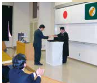
博士学位記の授与